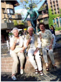
Sprockhöveler in Kaiserswerth