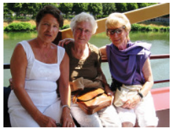
Schiffsrundfahrt auf der Maas