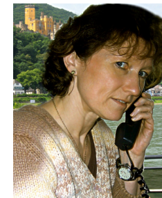
Bitte Anmeldeungs- beginn beachten.

€ 19,00 für Busfahrt und Eintritt für Aufführung