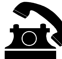
Bitte Anmeldeungs- beginn beachten.

Weitere Informationen zu den Fahrten erhalten Sie im städt. Seniorenbüro: Tel.: 02339 / 917-316