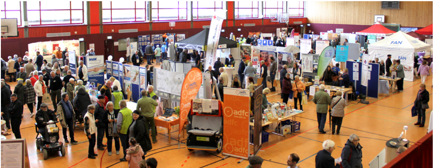
Seniorenmesse 2024

Auch die große Zahl der interessierten Bürger*innen machte in den vergangenen Jahren deutlich, dass die Seniorenmesse in der Glück-auf-Halle in Niedersprockhövel ein wichtiger Bestandteil des Sprockhöveler Veranstaltungslebens geworden ist. Mahlzeitendienste, Gruppen und Vereine sorgen bei den Messen für das leibliche Wohl. Die vom städtischen Seniorenbüro organisierte Seniorenmesse findet im jährlichen Wechsel mit der Hattinger Messe statt.