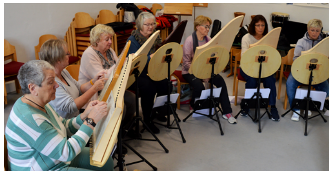
Veeh-Harfen-Ensemble der Musikschule

Für dauerhaften Unterricht empfiehlt sich die 10er-Karte für 250 Euro für 10 x 30 Minuten Einzelunterricht.