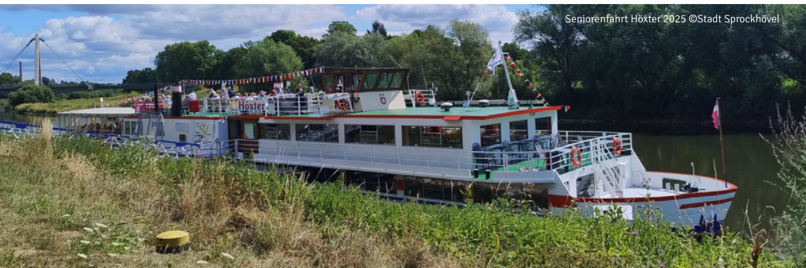
Seniorenfahrt Höxter 2025