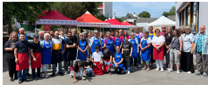
Die Helfenden der Seniorensommerfeier 2025

Daneben gibt es eine traditionelle vorweihnachtliche Feier, zu welcher der Vereinsring Haßlinghausen e.V. ebenfalls in Zusammenarbeit mit dem städtischen Seniorenbüro einlädt. Auch diese, bei Seniorinnen und Senioren sehr beliebte Veranstaltung, mit Kaffee und Kuchen und einem unterhaltsamen Programm, ist für die Gäste dank der finanziellen Unterstützung der Sparkassenstiftung Sprockhövel, dem Verein Unsichtbar e.V., der Hans-und-Irene-Eggers-Stiftung sowie der Hans-Werner-Dausend-Stiftung kostenfrei.