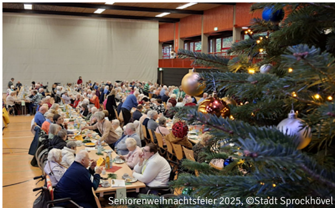
Seniorenweihnachtsfeier 2025

Stadtbücherei Sprockhövel Gevelsberger Str. 13, 45549 Sprockhövel ☎ 02339 917-152