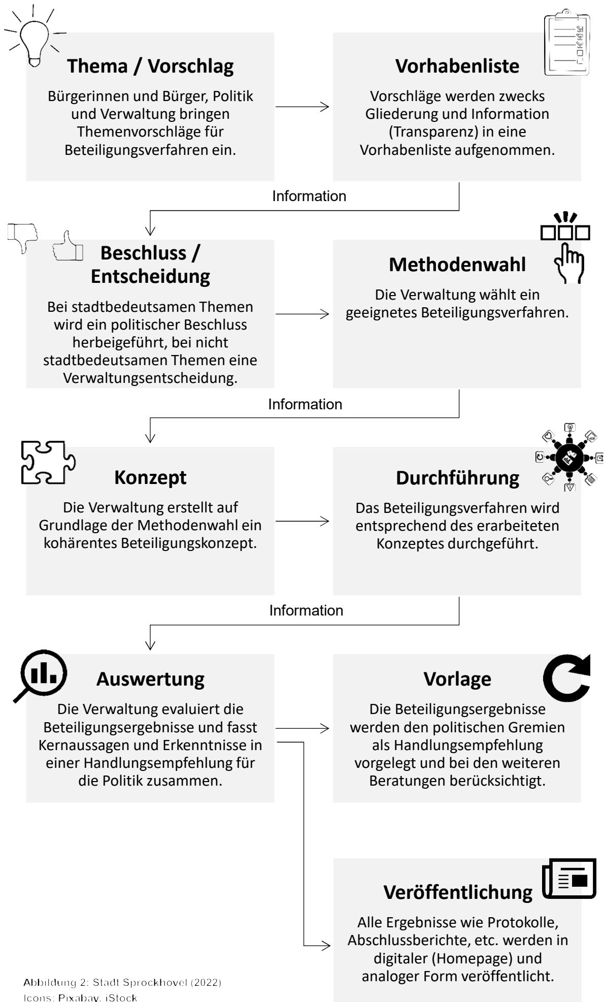
Abbildung 2: Stadt Sprockhovel (2022) Icons: Pixabay, iStock