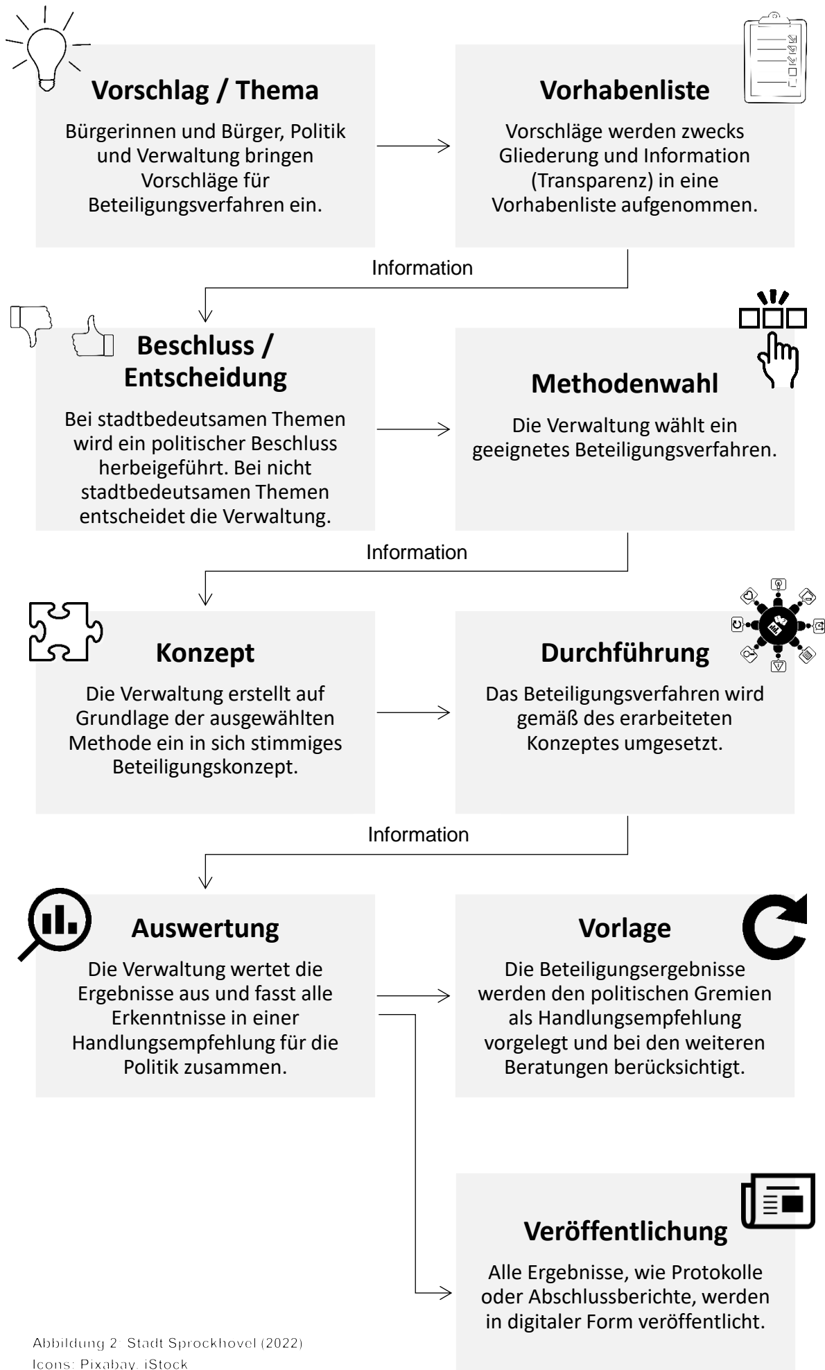
Abbildung 2: Stadt Sprockhovel (2022)