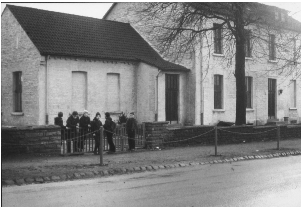
Volksschule Haßlinghausen Dorf, Gevelsberger Straße

In: Unsere Heimat. Volkskalender und Chronik des Kreises Hattingen und seiner Umgegend, Hattingen 1923. S. 46 ff