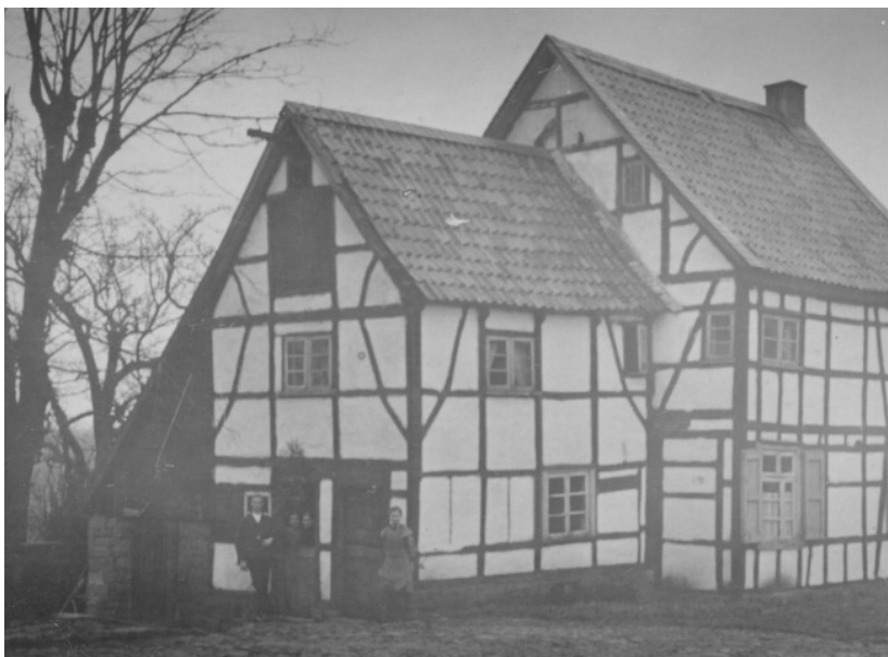
Ehemalige Schule Bräukelchen, Löhener Straße